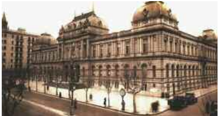
Edificio Central de la Facultad de Derecho

Comienza un nuevo año, sin poder dejar de reflexionar aún, respecto al año que pasó. El que pasó fue un año de intenso trabajo, pero también acotado en el tiempo, ya que hasta agosto se desarrolló el proceso eleccionario y luego el tema presupuestal. De todas formas logros se han obtenido, algunos de los cuales ya fueron referido en el último "Nexo", otros surgirán de esta publicación y de la Memoria correspondiente al período, la que desde ya se está elaborando.