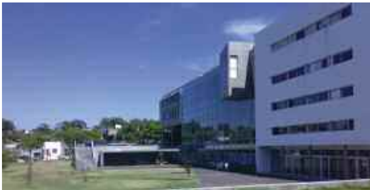
Edificio de la Regional Norte de la Universidad de la República

El Centro de Estudios de Derecho Comparado en el Mercosur (CEDECO), funciona en la Regional Norte de la Universidad de la República (Salto). Representa la culminación de un rico proceso académico de investigación y ex-