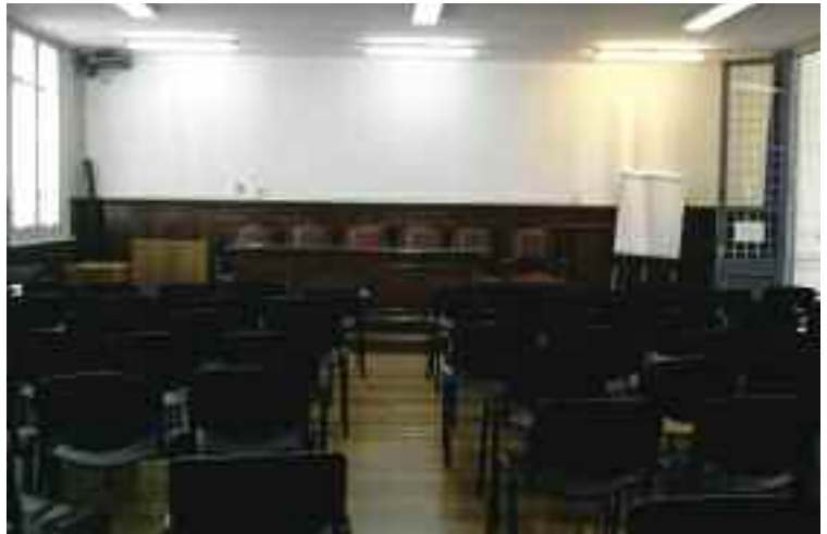
Aula Pablo de María (Salón 26) de la Facultad de Derecho