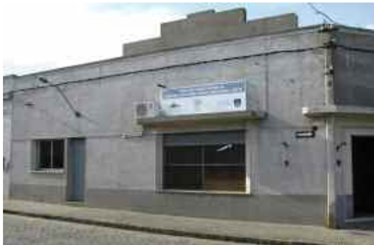
Centro Universitario Regional Este (CURE) de la Universidad de la República