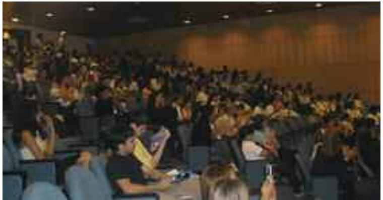
Interior del Aula Magna de la Regional Norte de la Universidad de la República