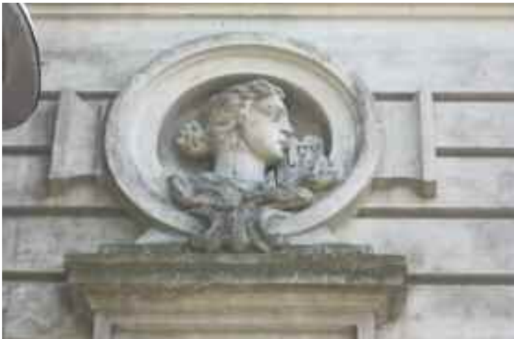
Detalle del edificio

Hoy llegan a nosotros estos documentos que nos enseñan las actuaciones administrativas tomadas a todos los niveles de ese hecho trascendental como lo fue la construcción, amueblamiento y recepción de nuestro edificio más emblemático de la Universidad de la República y del país, que fue