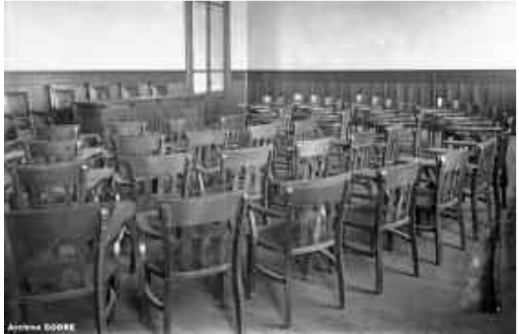
Detalles de amueblamiento de un salón de clases

Universidad Francisco Pisano informa que la Casa CAVIGLIA Hnos. depositó dinero como garantía de cumplimiento del contrato de construcción y colocación de mobiliario correspondiente al Consejo Directivo de la Facultad (Derecho, 1911).