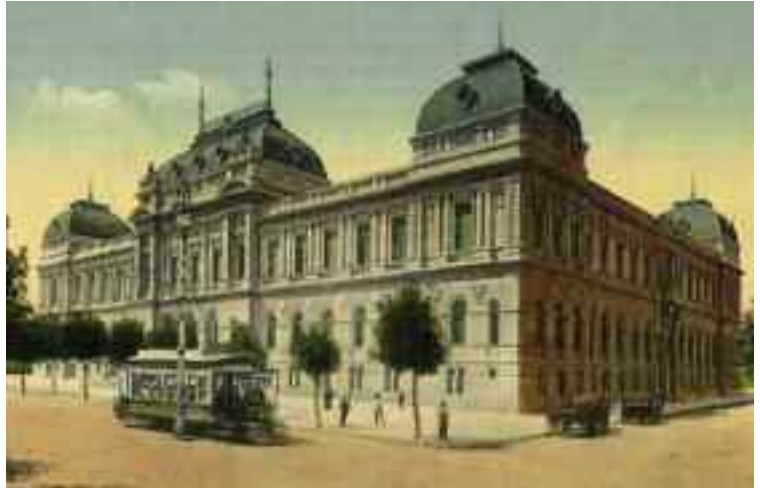
Facultad de Derecho hacia 1912

Esta búsqueda hizo posible hallar una serie de documentos de la