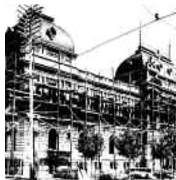
El edificio en construcción