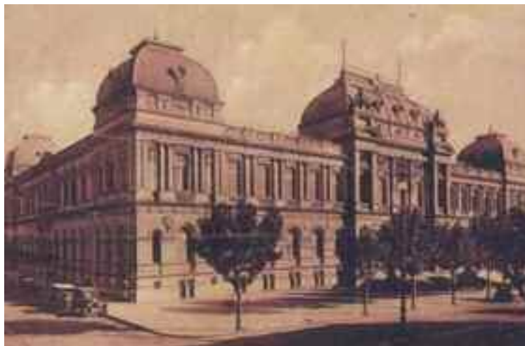
Facultad de Derecho hacia 1930

Ocupa un área de 10 mil metros cuadrados, incluyendo los entresijos destinados a aulas y oficinas se alcanza unos 12 mil metros.