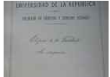
Carátula de expediente sobre recepción del edificio

El 16 de noviembre de 1911 un fuerte temporal azotó a la capital de Montevideo que provocó desperfectos en algunos salones del