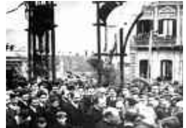
Colocación de la primera piedra del edificio

El nuevo edificio se construye de acuerdo al proyecto premiado de los arquitectos nacionales Juan M AUBRIOT, y Silvio GERANIO, que le dan a la construcción un carácter serio y simple, de acuerdo a las tendencias del renacimiento clásico, tratando al conjunto con un estilo de monumentalidad, que permite cuatro frentes en su inte-