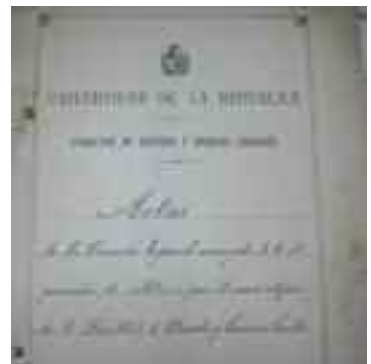
Actas de la Comisión Especial sobre compras directas

el pliego de condiciones formulado por la Secretaría para la adquisición de bancos que amueblarán los salones de clases de la Facultad y la adquisición en los Talleres de la Penitenciaría de dos docenas de bancos destinados a los corredores de la Facultad.