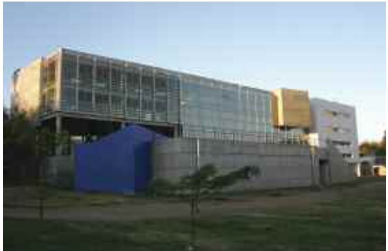
Regional Norte, Sede Salto de la Universidad de la República