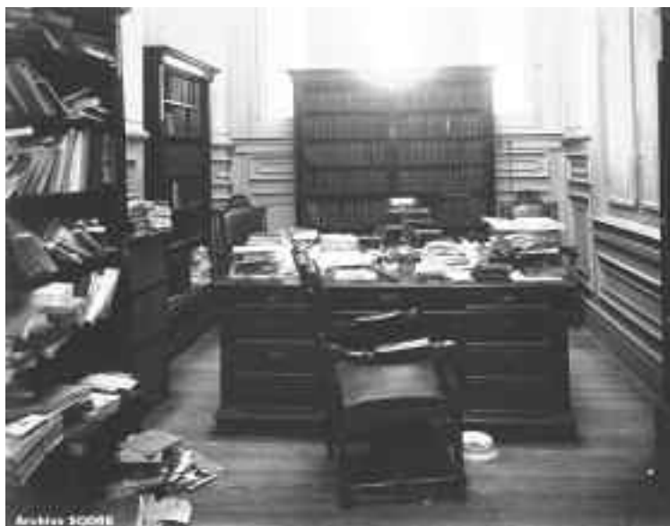
Sala del director de la biblioteca

el derecho de rechazar todas las propuestas si así lo estima conveniente.