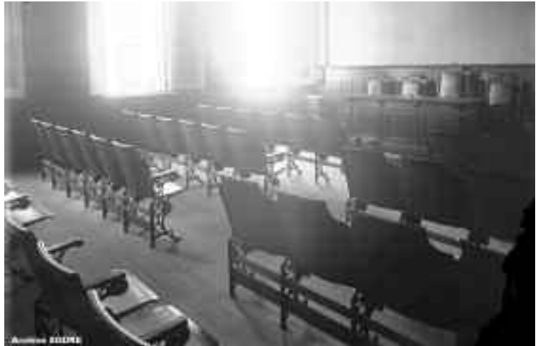
Detalle de un salón de clases

3 escritorios y 2 mesas americanas, 4 bibliotecas ídem, 3 archivos grandes ídem, 1 baranda, 2 archivos chicos ídem, 1 juego inglés compuesto por un sofá, tres sillones y cuatro sillas, 4 sillones giratorios, mesas para máquinas de escribir y prensa, 2 alfombras, 3 alfombritas, camineros, visillos,